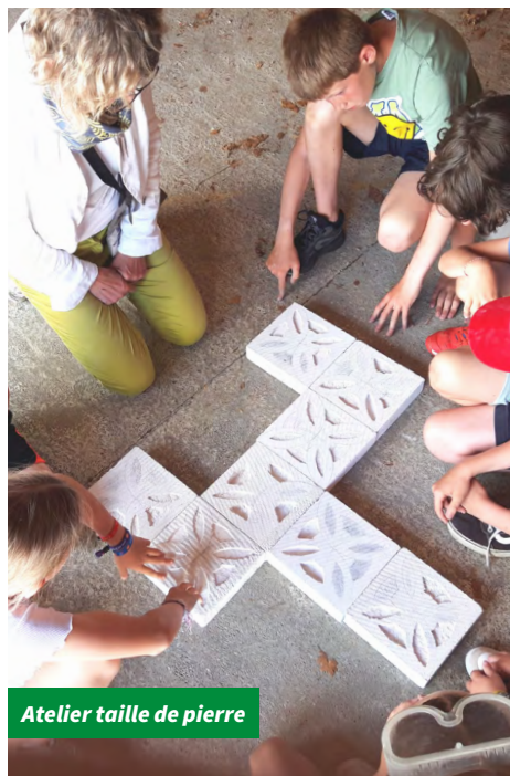
Atelier taille de pierre