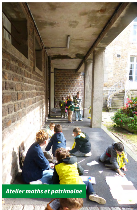
Atelier maths et patrimoine