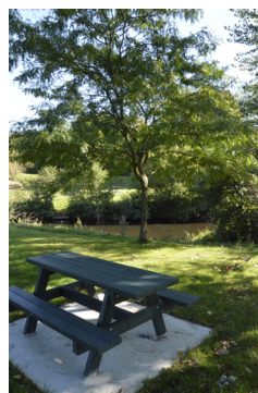
Table de pique-nique au bord de la Sienna

Passant au moulin de Sey, vous partez à la rencontre de la Sienna : ce fleuve côtier qui se jette dans le Havre de Regnéville est un lieu de rencontre de grands migrateurs. A l'automne, le saumon atlantique quitte le monde maritime puis remonte le cours d'eau pour aller se reproduire. C'est à cette période que l'oiie bernache cravant à ventre pâle, en provenance des pays nordiques, prend ses quartiers d'hiver sur les prés salés du Havre de Regnéville. En été, les lamproies marines et lamproies fluviatiles (poissons sans machoires avec une ventouse) se retrouvent à leur tour sur les frayères de la Sienna. Enfin, n'oublions pas l'anguille, qui colonise les eaux douces du bassin versant après un long voyage depuis sa zone de reproduction de la mer des Sargasses.