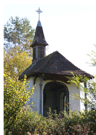
La chapelle des ermites

Érigée en 1903 par Madame de Bérenger, propriétaire du manoir de Treilly, cette chapelle est dédiée à la Vierge Noire de Einsiedeln, situé dans un monastère de Suisse Allemande. Cette chapelle se trouve sur un terrain privé mais on l'aperçoit pendant le circuit.