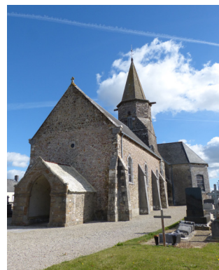
L'église de Montsurvent

L'église Saint Martin de Montsurvent, en forme de croix latine aux angles abattus, se dresse sur l'un des points les plus élevés de la commune. Un grand arc en granit, du XVI e siècle, donne accès au porche. Le portail, en pierre calcaire, date du XIV e siècle. La nef a remplacé en 1854, un vaisseau, qui avait été réparé en 1660, mais qui était moins large que le chœur. Le clocher, situé entre la nef et le transept, repose sur quatre massifs polygonaux des XIV – XV e siècles.